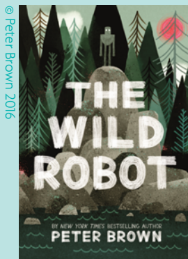
The Wild Robot by Peter Brown