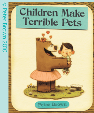
Children Make Terrible Pets by Peter Brown